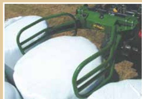
Konstruktion på griparm