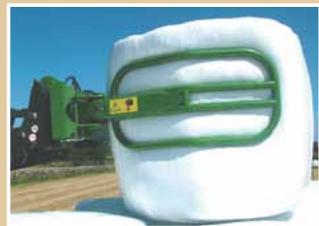
Stängning nära redskapsfästet

En mycket kraftig hydraulkolv med backventil säkrar ett konstant grepp när balen transporteras.