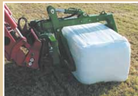
Konstruktion med bakre griparm

Gripen kan enkelt justeras för att passa olika balstorlekar.