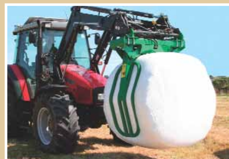
Låsbara armar & konstant grepp