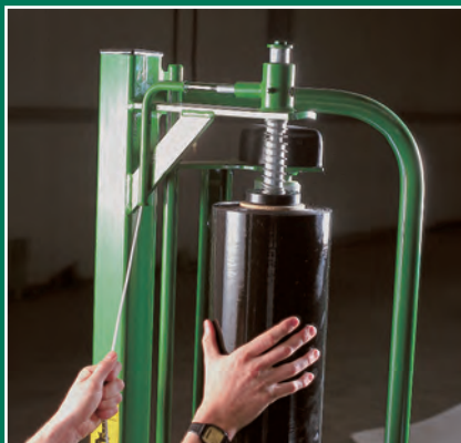
Bloquear una nueva bobina