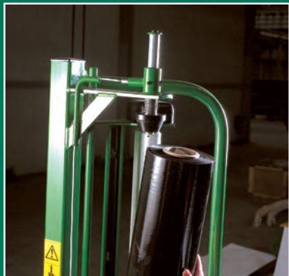
Recargar una nueva bobina