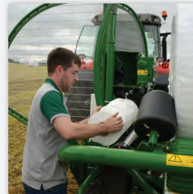
ENKEL LASTING AV FILMRULLER